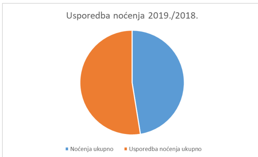
Slika 4 Grafički prikaz usporedbe turističkih noćenja 2019. i 2018. godine

Analizom broja ostvarenih noćenja vidimo da je tijekom 2019. godine ostvareno 18.541 noćenje od čega su domaći gosti ostvarili 10.845 noćenja a strani gosti su ostvarili 7.696 noćenja (slika 3). Ukoliko ove podatke uspoređujemo sa 2018. godinom ostvareno je 1.993 noćenja manje (slika 4). U strukturi ostvarenih noćenja domaći gosti su 2019. godini ostvarili 1.848 noćenja manje u odnosu na 2018. a strani gosti su ostvarili 136 noćenja manje u odnosu na 2018. godinu. Gledajući postotno u 2019. godini je ostvareno 9,7% manje noćenja u odnosu na 2018. godinu. Od čega su domaći gosti ostvarili 14,6% a strani 1,7% noćenja manje u odnosu na 2018. godinu.