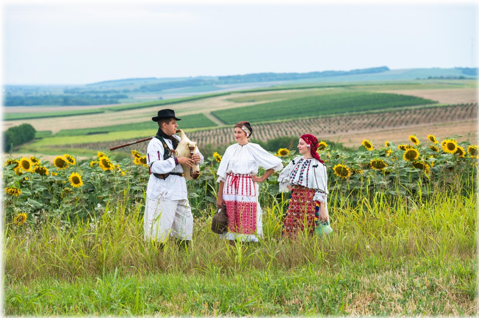
Slika 1