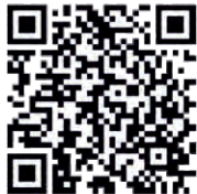
Preuzmite iOS aplikaciju o Baranji: