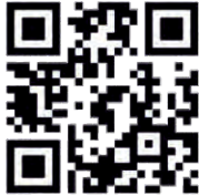
Turistička zajednica Baranje