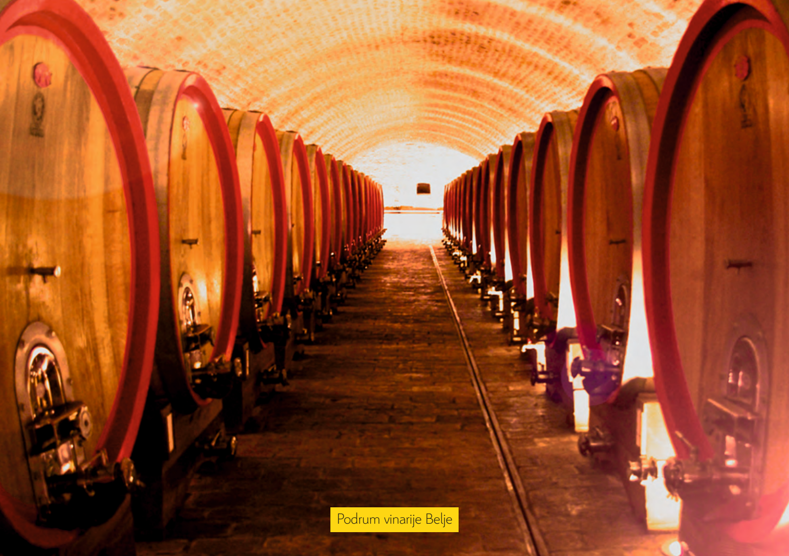
Podrum vinarije Belje