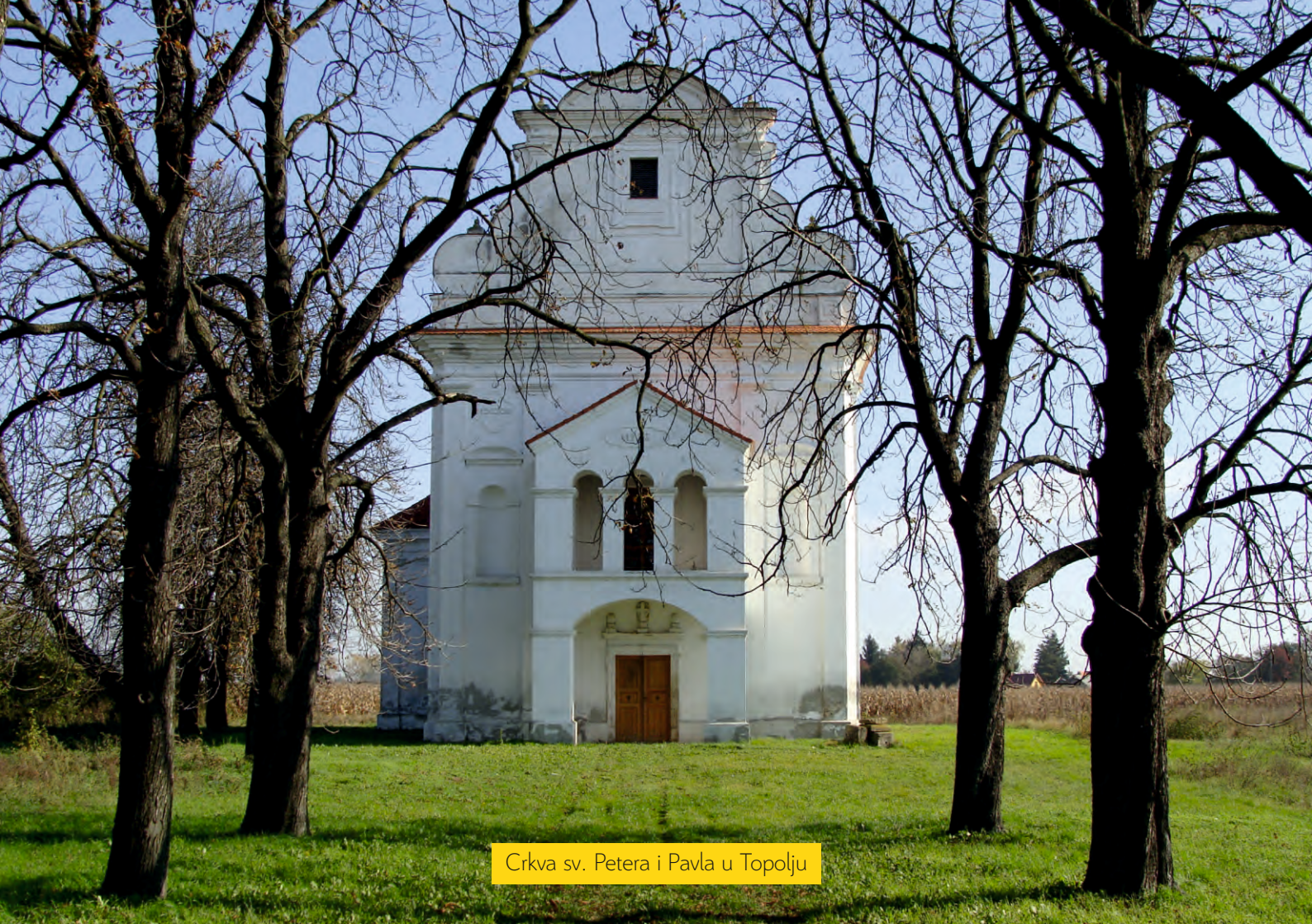
Crkva sv. Petera i Pavla u Topolju