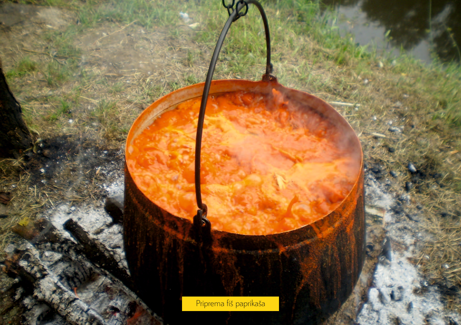
Priprema fiš paprikaša