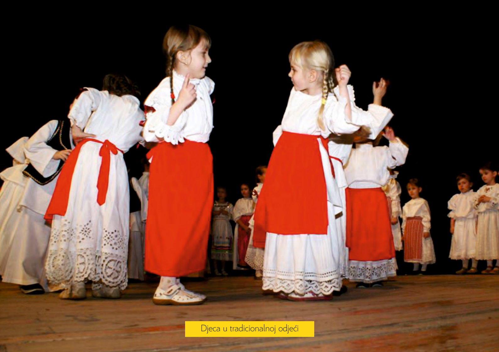
Djeca u tradicionalnoj odjeći