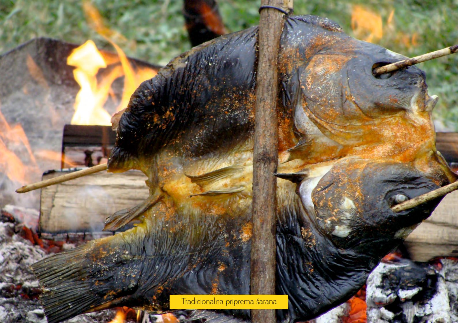
Tradicionalna priprava šarana