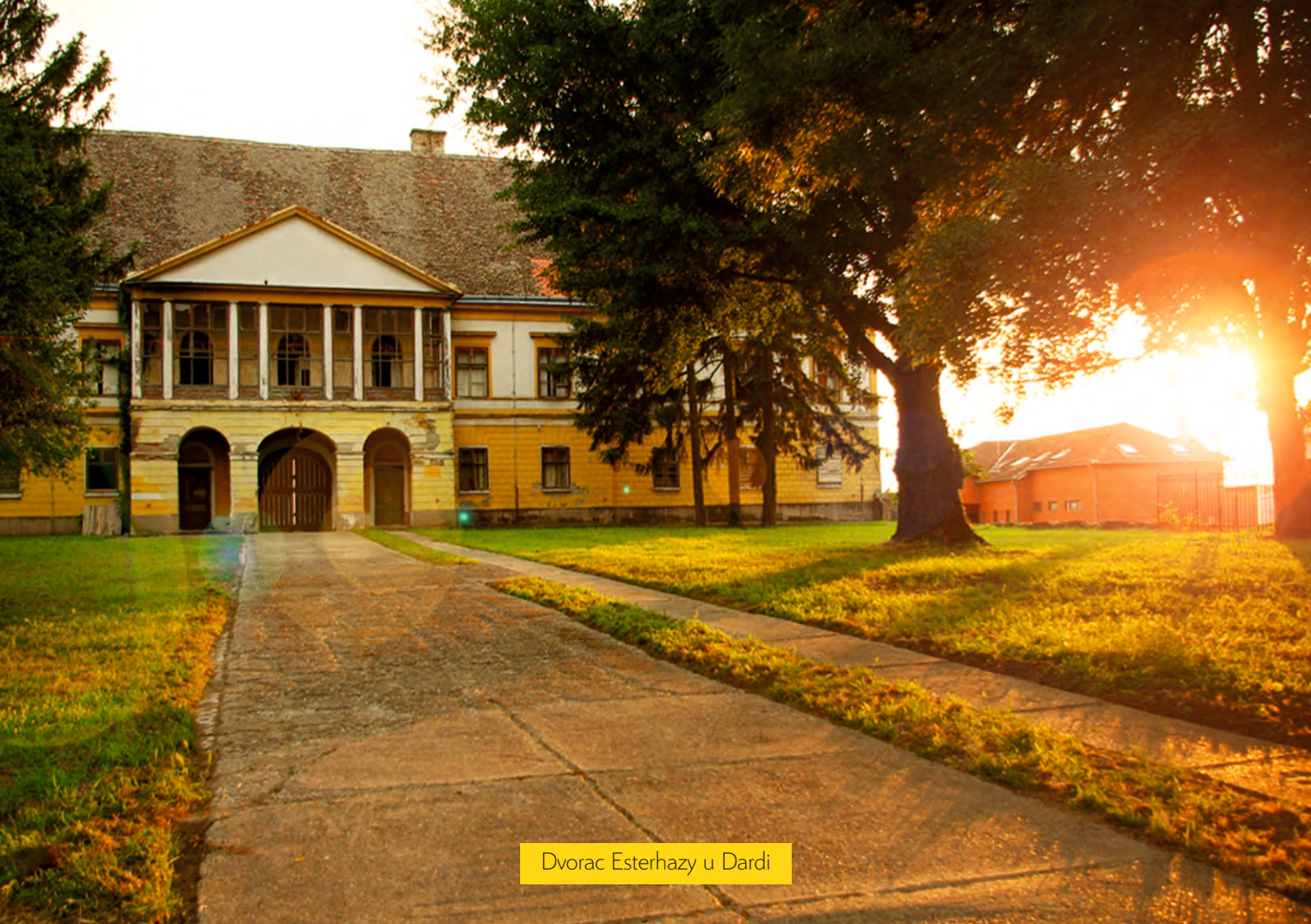
Dvorac Esterhazy u Dardi