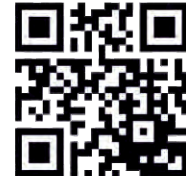
Turistička zajednica Općine Draž